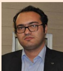
کارشناس اداره تغذیه تلفن داخلی: 1511 ایمیل: